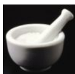
Dextrine 0.44 gr