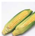
Fibre végétale 0.20 gr