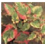
Cordata de Houittuynia 0.04 gr