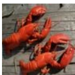
Chitosan 0.04 gr