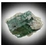
Tourmaline 2.00 gr