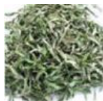
Feuille de loquat 0.04 gr