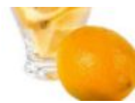
Vitamine C 0.04 gr.